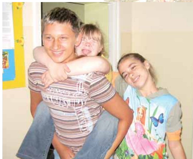
... ale uwielbiają wszelkie wycieczki.