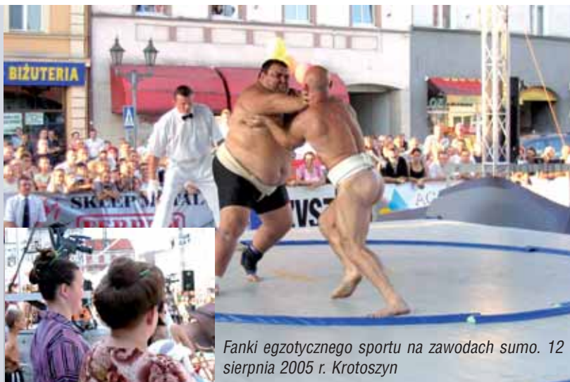
Fanki egzotycznego sportu na zawodach sumo. 12 sierpnia 2005 r. Krotoszyn

Na lokalnych, regionalnych, ogólnopolskich oraz międzynarodowych zawodach Krotoszyn reprezentują kluby sportowe: LKS Ceramik , KS Astra , Tworzystwo Atletyczne Rozum , KS Krotosz , prężnie działające szkolne kluby sportowe oraz Ośrodek Sportu i Rekreacji. Na szerokim forum godnie reprezentują nas zawodnicy w rozmaitych dyscyplinach, jak na przykład: sumo, zapasy, karate, piłka nożna, korfbal, biegi i pływanie.