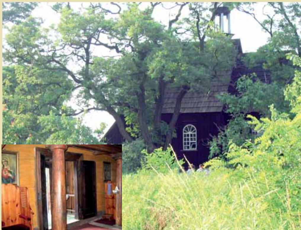
Kościół św. Marii Magdaleny zbudowano w XVIII w. w miejscu kościoła funkcjonującego od XIII w.

pl. Jana Pawła II, pomnikowi Wolności. Został on wystawiony w 2006 r. w miejscu dawnego postumentu, nie istniejącego do kilkudziesięciu lat. Stąd już bardzo blisko do parku miejskiego założonego w pierwszej połowie XIX. Dla miłośników aktywnego wypoczynku atrakcją będzie Kryta Pływalnia z Ośrodkiem Rehabilitacyjnym Wodnik , basen otwarty, skatepark oraz piesze i rowerowe szlaki turystyczne w okolicach Krotoszyna.