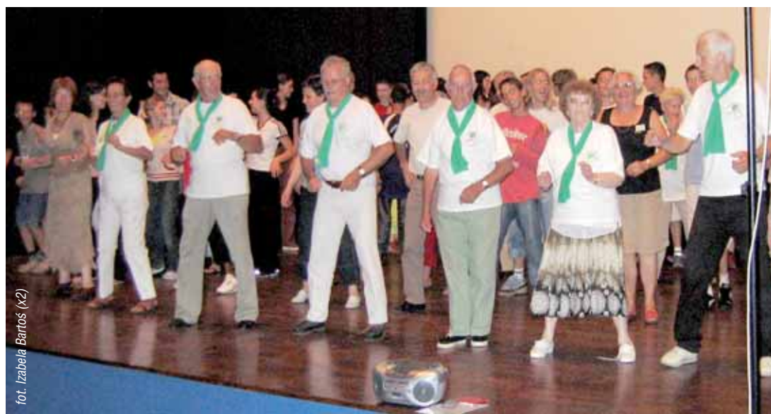
Dwa lata temu francuscy seniorzy pokazali nam, w jaki sposób popołudniami podtrzymują kondycję, bawiąc się przy tym doskonale

Ponieważ debata będzie miała specjalistyczny charakter, ze strony gości wezmą w niej udział, oprócz mera i jego zastępcy, tylko rolnicy oraz radni miejscy. Krotoszyn będzie na niej reprezentowała podobna grupa. Pogłębieniu wiedzy zainteresowanych osób na temat naszego rolnictwa będzie służyła wycieczka poglądowa do trzech podkrotoszyńskich gospodarstw, zaplanowana na ten sam dzień. Ze swoim warsztatem pracy zgodzili się zapoznać