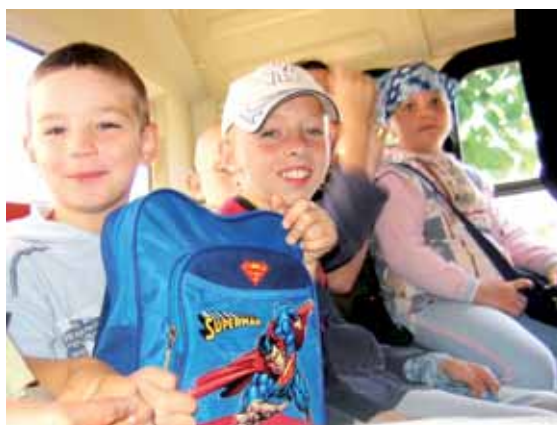
... ale uwielbiają wszelkie wycieczki.