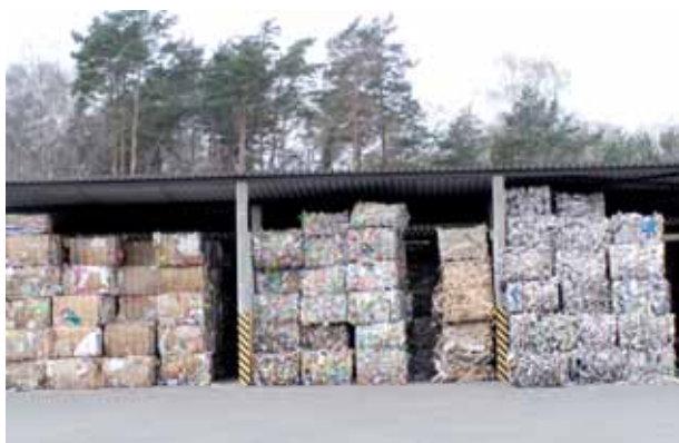
Spraszane paczki surowców wtórnych czekają na odbiór

Oprócz tego będzie budynek administracyjny z portiernią; budynek socjalny z szatniami, łazienkami oraz jadalnią z aneksem kuchennym; zaplecze techniczno-warsztatowe z pomieszczeniem do napraw pojazdów i dystrybutorem paliwa na potrzeby wewnętrzne zakładu.