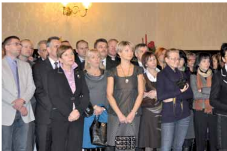
Z zaproszenia burmistrza skorzystało około 150 przedstawicieli firm.