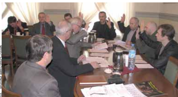
Komisja Społeczna podczas obrad

21 i 22 stycznia obradowały komisje stałe Rady Miejskiej w Krotoszynie.